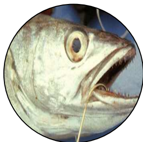
( Merluccius australis )