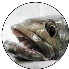
( Dissostichus eleginoides )